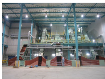
環境プラント事業