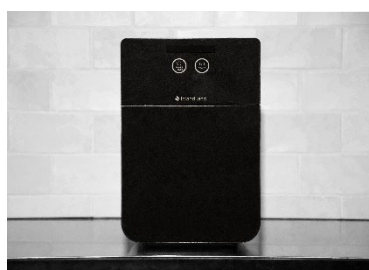
環境製品 研究・開発